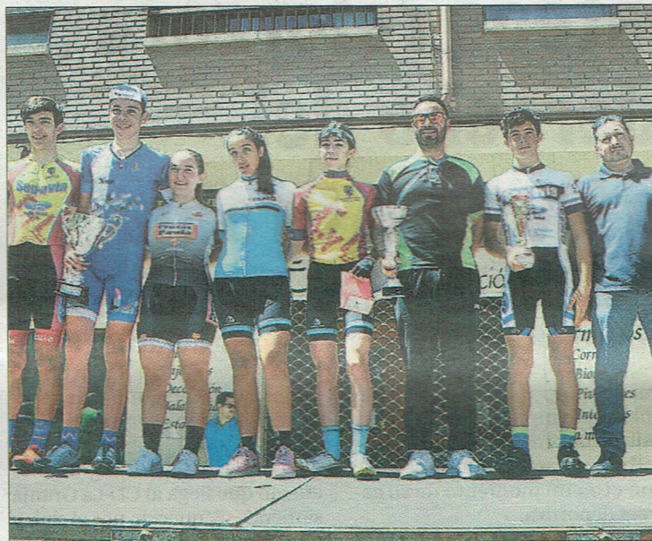
Uno de los podios del Trofeo Pedro Luis García.